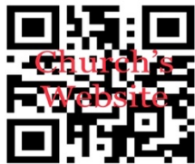
SITIO WEB PARROQUIAL