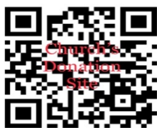
HACER SU DONACIÓN