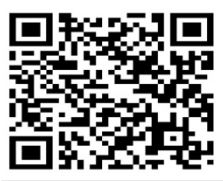
LECTURAS DE HOY